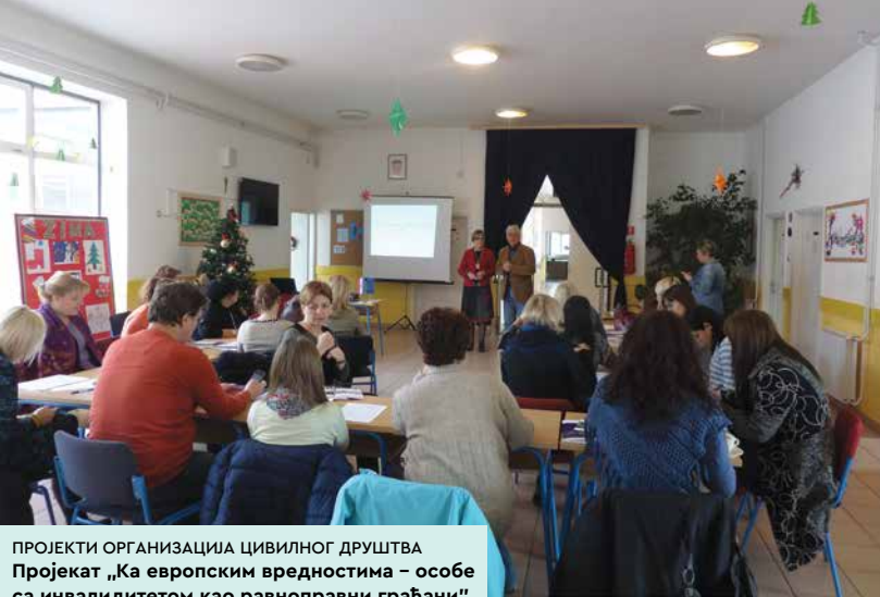
ПРОЈЕКТИ ОРГАНИЗАЦИЈА ЦИВИЛНОГ ДРУШТВА Пројекат „Ка европским вредностима – особе са инвалидитетом као равноправни грађани“ АПИ Србије www.facebook.com/sapi.europe.for.citizens