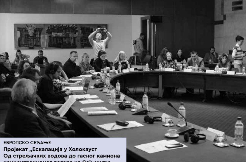
ЕВРОПСКО СЕЋАЊЕ Пројекат „Ескалација у Холокауст Од стрељачких водова до гасног камиона концентрационог логора на Сајмишту: Две одлучујуће фазе Холокауста у Србији” Историјски архив Београда www.arhiv-beograda.org/holokaust